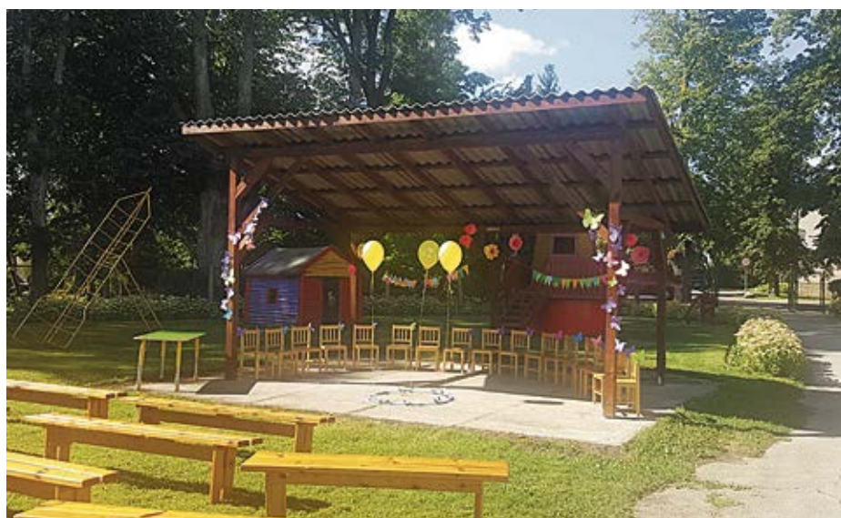
Pirmsskolas izglītības iestādes „Dzirnaviņas” pagalmā izveidota brīvdabas skatuve.