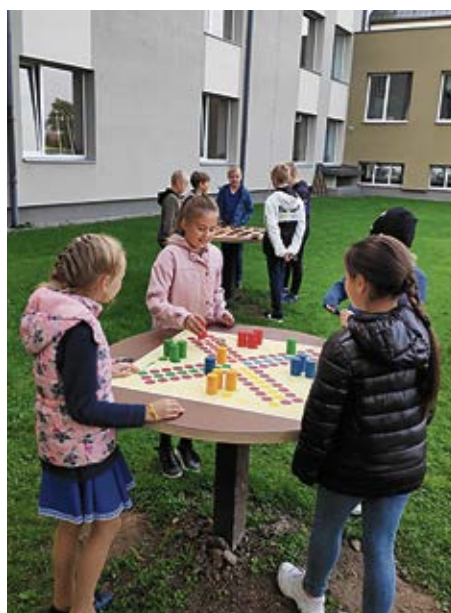
Idejas brīvā laika pavadīšanai Bauskas Valsts ģimnāzijas teritorijā.