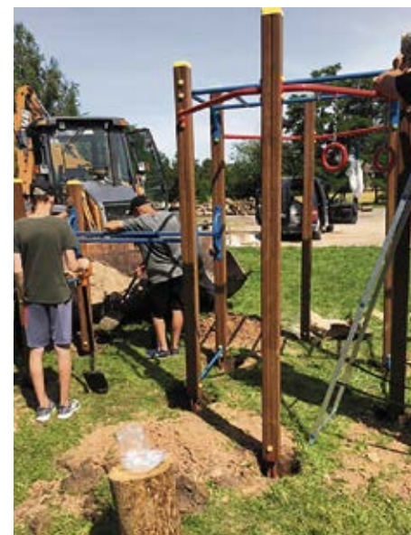
Pie Grenctāles kultūras nama izveidots jauns bērnu rotaļu laukums.