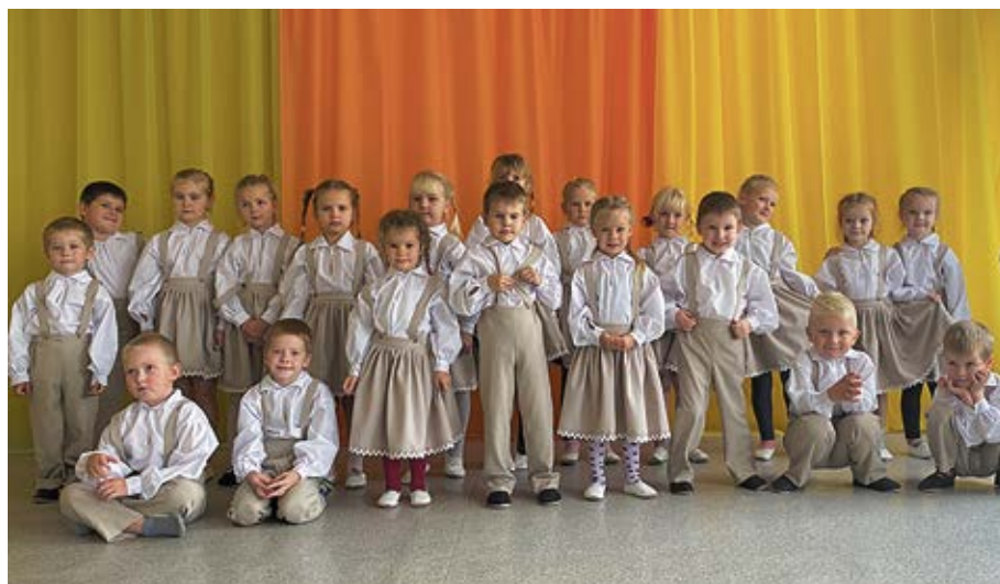
Ceraukstes pagasta bērnu deju kolektīvs „Spriguliši” demonstrē par projekta līdzekļiem darinātos deju tērpus.