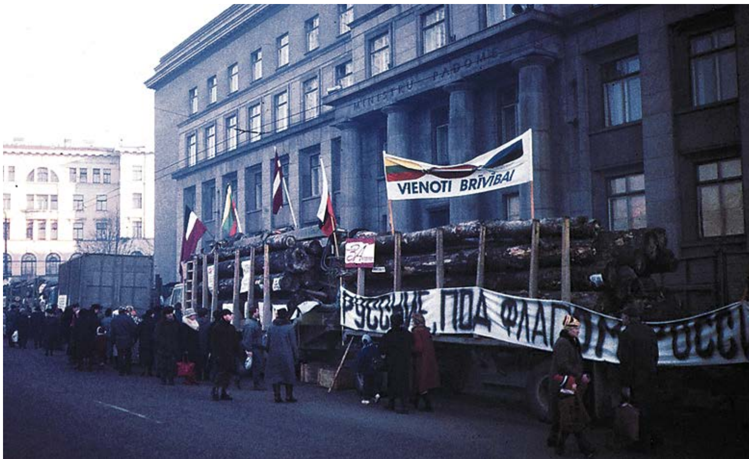
Barikāžu apjotais toreizējais Ministru padomes nams. To aizstāvēt bija gatavi daudzi baušķenieki.

Notikumi pirms 30 gadiem vairs nav vērtējami kā nesena pagātne, jo starplaikā izaugusi vairāk nekā viena paaudze. Latvijas Tautas frontes 1991.gada 13.janvārī sarīkotajā protesta manifestācijā pret PSRS patvaļu Baltijā piedalījās aptuveni pusmiljons dalībnieku, starp tiem bija vairāki tūkstoši Bauskas rajona iedzīvotāju. Pirms demonstrācijas tika saņemtas pirmās ziņas par bruņoto uzbrukumu mīrmīlīgiem demonstrantiem pie Viļņas TV torņa. Daugavpilā izskanēja aicinājumi veidot barikādes Rīgā un neļaut PSRS karaspēkam pārņemt stratēģiski svarīgos objektus. Daudzi demonstranti uzreiz pēc manifestācijas steidzās uz mājām, lai pēc īsa brīža dotos atpakaļ uz Rīgu un piedalītos barikāžu veidošanā. Vieni no pirmajiem, kas ar