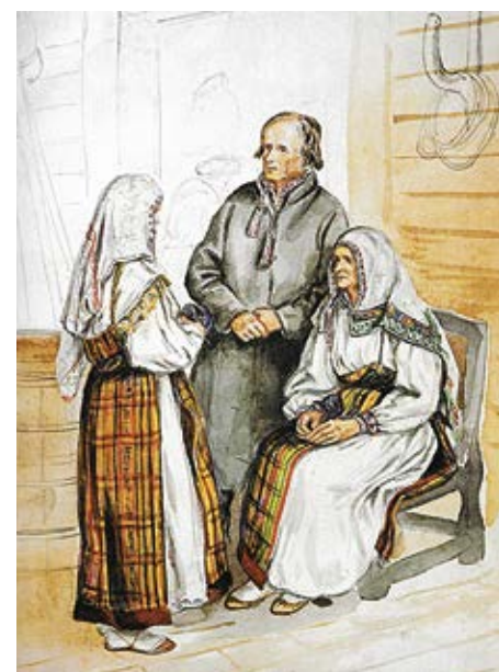
Krievu tautas tērpu rekonstrukcijas 1.kārta.