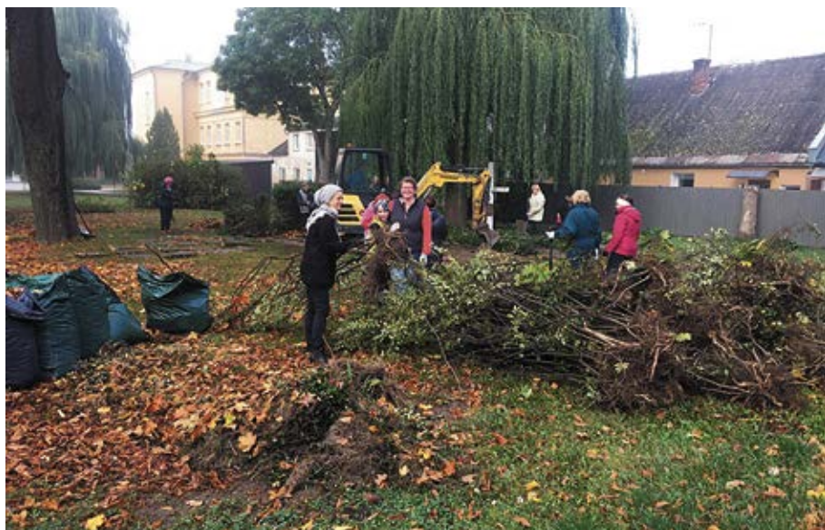
Sakopts Bauskas SV. Gara baznīcas dārzs.