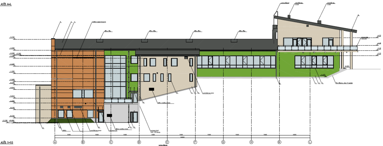
FASĀDE A5IS 1-10

Būve projektēta divos apjomos - sporta zāles apjoms un administratīvais korpuss. Ēkai ir seši līmeņi un tā ir novietota reljefā, iebūvējot katru līmeni esošā reljefā. Zemes gabalu ap sporta būvi ir paredzēts labiekārtot – izbūvēt tenisa laukumus austrumu pusē.